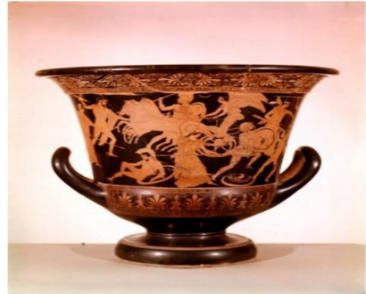
Ferrara – Museo Archeologico Nazionale "Cratere del pittore dei Satiri villosi"

Si dedica poi all'esplorazione e scavo della necropoli, scoperta nel 1922, della città portuale etrusca di Spina, che dal 1925 sotto la sua direzione, restituisce ricchi reperti specialmente di ceramica greca. I reperti sono esposti presso il Museo Archeologico Nazionale di Ferrara, fondato da Aurigemma, che si trova nel Palazzo Costabili a Ferrara ed è stato inaugurato nel 1935.