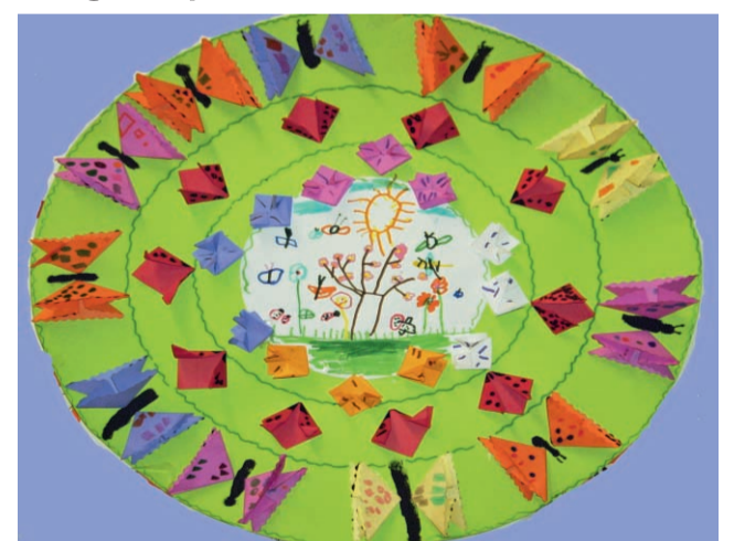
Origami di primavera sez. H