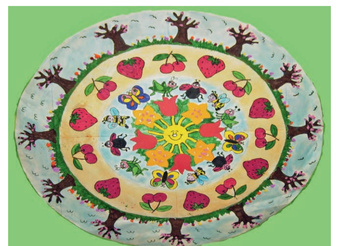
Primavera in fiore sez. D