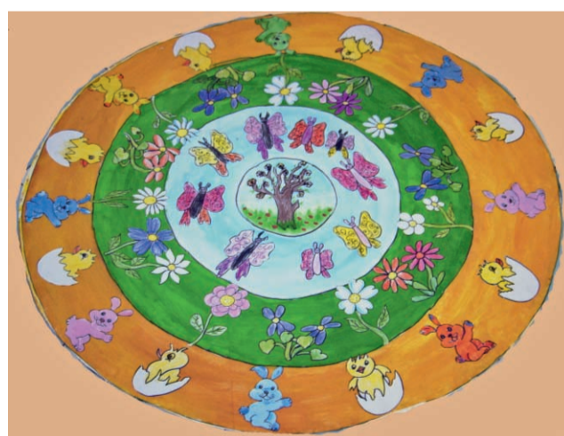
Bentornati cuccioli e fiori sez. C