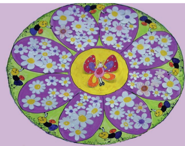
Tutti per uno, uno per tutti sez. A

Dopo il freddo inverno e le abbondanti nevicate il nostro viaggio continua, attraverso un cerchio infinito, alla scoperta di sapori, di colori e odori diversi. I mandala di questo numero rappresentano un mondo in attesa del risveglio: un mondo che, lentamente si schiude e si apre a noi. Non è un sogno il sole che nasce e che tramonta. Non è un sogno l'uccellino che nasce dentro il nido, e non è un sogno la farfalla che esce dal bruco. Sono invece realtà alla portata di tutti. I colori che attraversano la primavera sono davvero un regalo della natura. I nostri bambini, con il loro vociare spumeggiante e il loro comportamento imprevedibile, sono in sintonia con le novità della primavera.