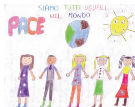
Disegno della classe V B Sc. Primaria Montessori

Non si può descrivere neanche con mille parole il libro che abbiamo letto "Il razzismo spiegato a mia figlia" di Tahar Ben Jelloun. Il suo contenuto arricchisce la nostra mente con pagine meravigliose e ricche di insegnamenti e ci prepara ad affrontare meglio alcune problematiche attuali. Il razzismo è un cattivo comportamento che tende a discri-