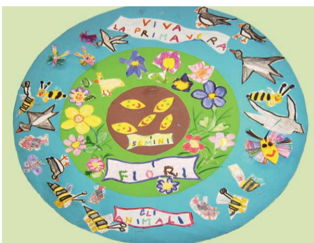
Risvegli: dal seme al fiore sez B