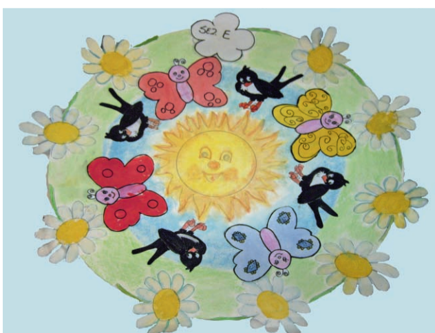
Un caldo risveglio sez. E