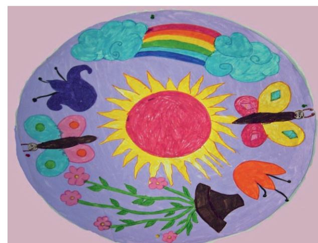
Un arcobaleno di colori sez. F