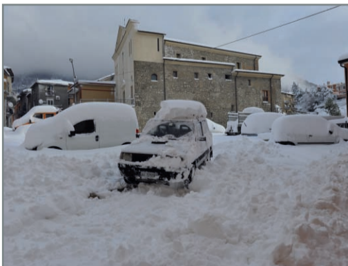
Monteforte sommersa dalla neve

In questi ultimi giorni sul nostro paese, Monteforte, è caduta tanta neve, come non se ne vedeva da moltissimi anni. Venerdì ho aperto la finestra e ho visto il paesaggio innevato, tutto era ricoperto da una trapunta morbida e bianca. Dal cielo grigio chiaro continuavano a cadere lentamente, come in una danza, fiocchi di neve. Le montagne, in lontananza, avevano le cime incappucciate di bianco che sembravano zucchero filato. Gli alberi assomigliavano a gelati alla panna e alcuni avevano i rami piegati per il peso della neve. La neve aveva ricoperto anche i tetti e i balconi delle case e sul mio, ogni tanto, vedevo le impronte lasciate dagli uccellini in cerca di cibo. Con i miei amici ci siamo divertiti