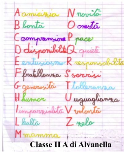
Classe II A di Alvanello