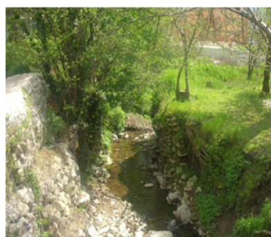
Il Rio Paradiso