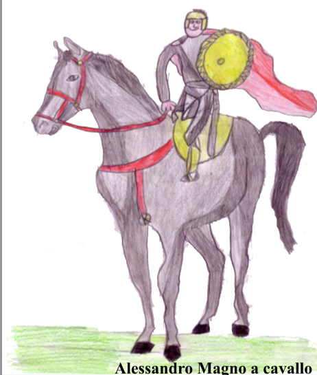
Alessandro Magno a cavallo

Dopo la realizzazione della biblioteca di classe ho scelto un testo da leggere.