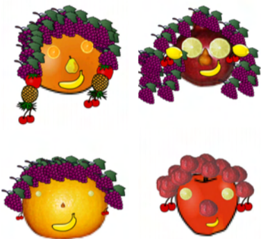
A cura della I A e I B di Piazza