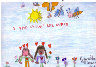
Classe I A di Alvanella